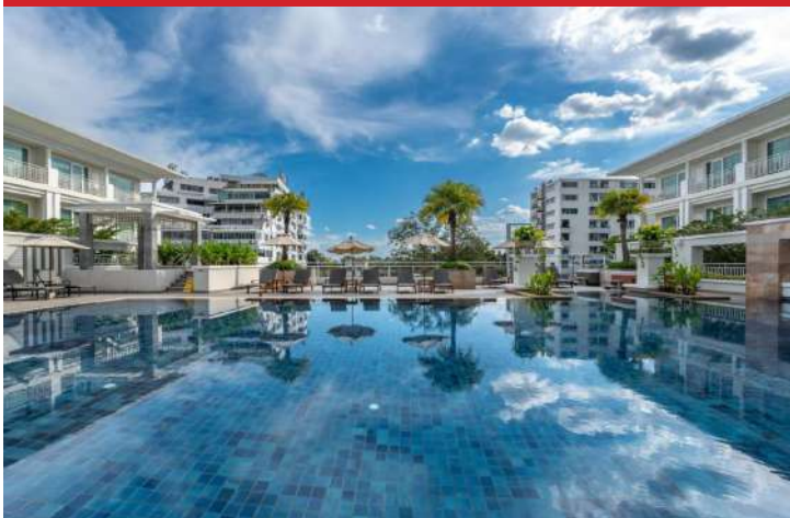
Hotel Kantary Hills