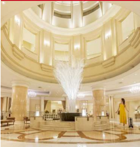
Grand Nikko Tokyo