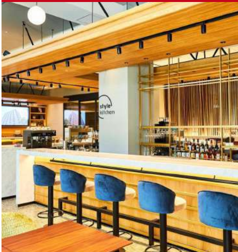
Nikko Style Nagoya