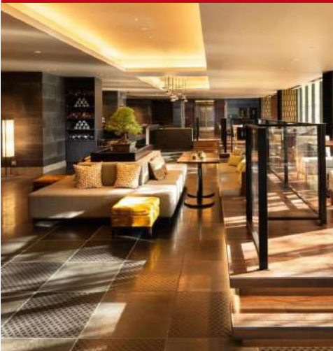
Double Tree Kyoto Station