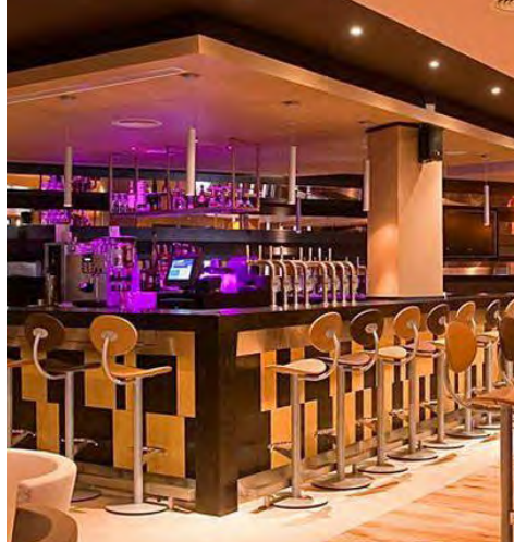
Maldron Hotel Limerick