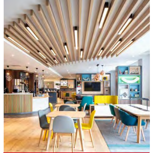
Holiday Inn Belfast