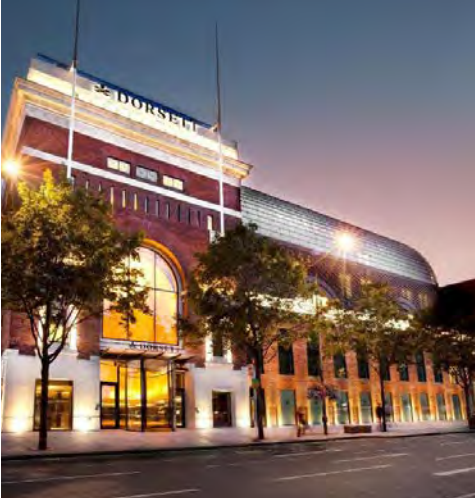
Dorsett Shepherd's Bush