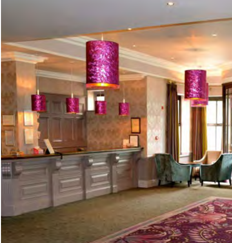
Maldron Hotel Oranmore