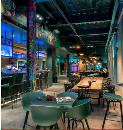
Moxy Merchant City