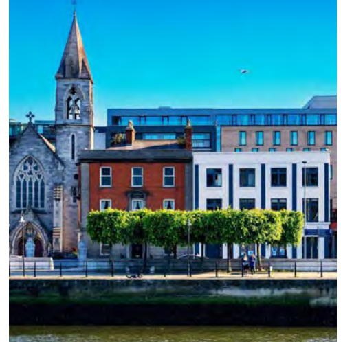
Staycity Dublin City Quay