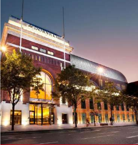
Dorsett Shepherd's Bush