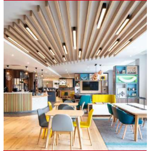
Holiday Inn Belfast