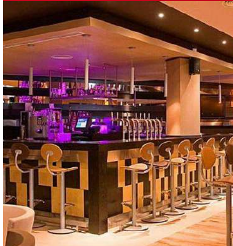
Maldron Hotel Limerick