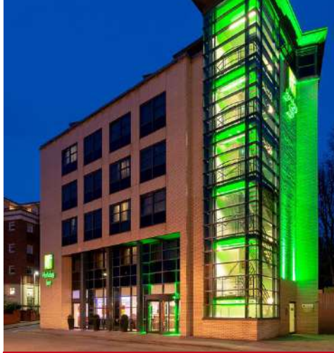
Holiday Inn York