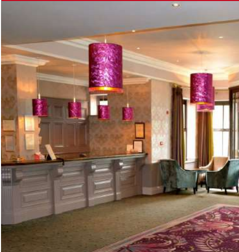
Maldron Hotel Oranmore