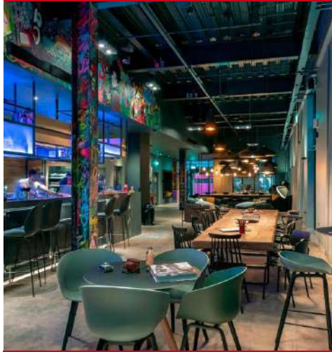
Moxy Merchant City